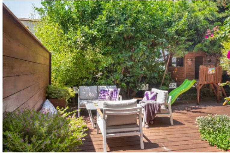
דרך סבירה יותר ליהנות מהעצים שמקיפים את הבית - הגינה

"בקומת הקרקע יצרתי משרד עם חזית שקופה עבור אם המשפחה על מנת שתוכל לעבוד מהבית ולהיות על יד ובקשר עם הילדים - פרטיות ובד בבד גם שקיפות", מסבירה המעצבת. "ספת הרי"ש ששמקמת בסלון תוכננה CUSTOM MADE עבור בני המשפחה ומאפשרת מבט פתוח לעבר הגינה, כך שניתן ליהנות ממנה גם מבפנים. את המטבח החדש עיצבתי בצורת חזית ובו דלפק לארוחת בוקר או ארוחות קלות".