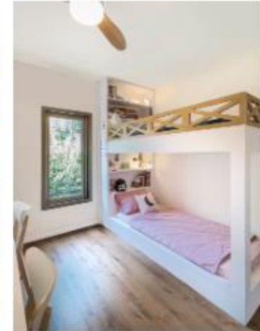
מיטת קומפוזיט קטומה תוכננה ויצרה בהתאמה אישית על ידי בנו מכשר