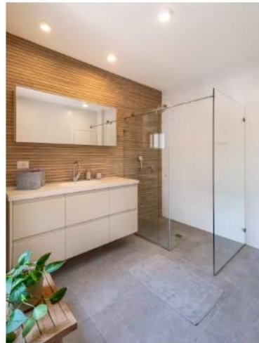
המעצבת יצרה בהם קירות כוח בעזרת אריחי גרניט פורצלן דמוי עץ