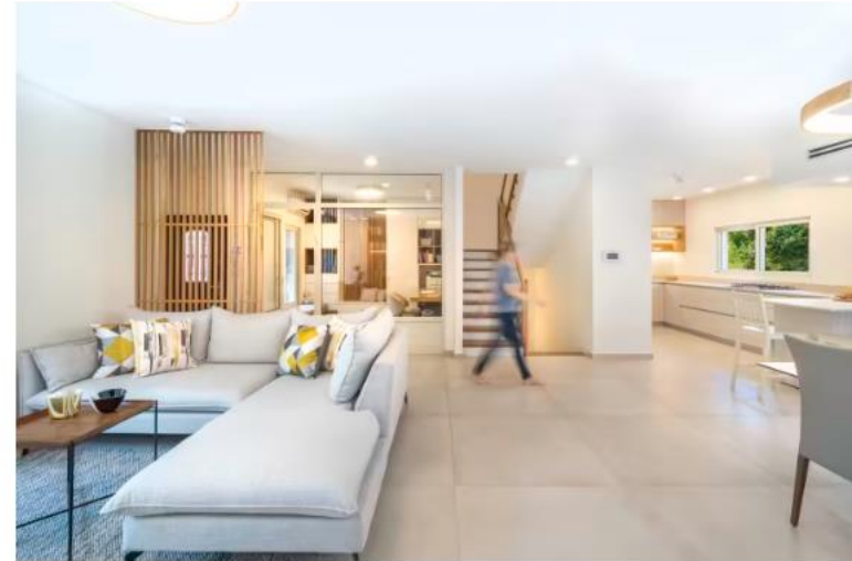
מיוזג בין סקנדינבי ליפני. בית פרטי ששופץ ועוצב בסגנון 'ניפנדי'. עיצוב פנים: תמר פרוידמן