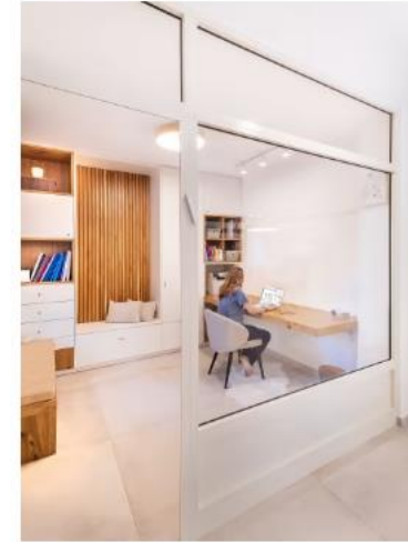
בעלת הבית קיבלה משרד נאה עם חזית שקופה

חדר השינה של ההורים מעוצב בצבעים רגועים, ללא מסך טלוויזיה - מינימום הפרעות ונחמות ומקסימום הרמוניה שבאה לידי ביטוי בריהוט ובאלמנטים השונים. בחדרי השינה של הילדים הגדולים תכננה המעצבת מיטת קומתיים קסומה בעזרתו של נגר אומן שמכניסה לחדר המון אופי. בנם הקטן של השניים זכה בחדר בעיצוב צעיר יותר שמתאים לנילו, אבל עם אופציה לשנות אותו בקלות בעתיד, ללא הרבה הוצאות, ולהתאימו לילד המתבגר.