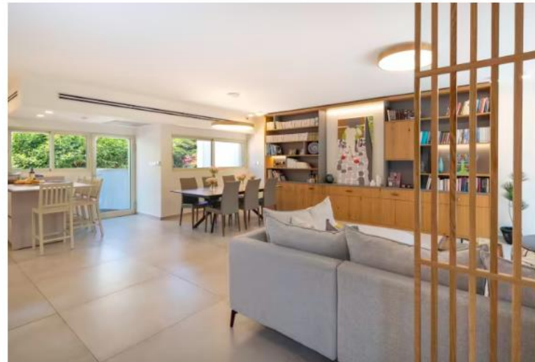
במשך שנים, העץ שבחית הבית שלח שורשים ארוכים מתחת לרצפת הבית, באין מפריע