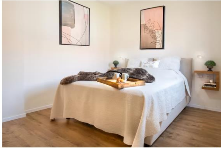
צבעים רגועים ואפס נוכחות של מסכים. חדר השינה של ההורים

אריחי גרניט פורצלן גדולים (1.20/1.20 מ') הודבקו על גבי הריצוף הישן. על שלחי מדרגות הבטון הודבקו פלחי עץ נושני שפונש פרקט בגוון זהה שנבחר עבור קומת המגורים. בחדרי הרחצה יצרה פרוידמן קירות כח עשויים אריחי גרניט פורצלן דמוי עץ, שמהדהדים את האווירה בבית.