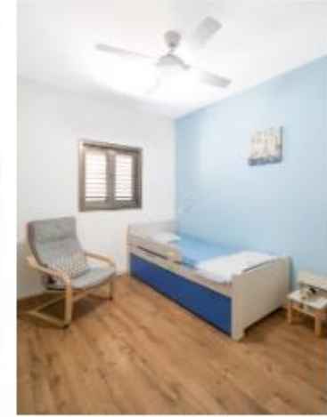
על הדרך תכנן החדרים השתנה כדי להתאים לצרכי הילדים