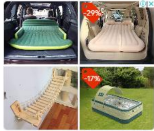
AliExpress Official AliExpress

"עשינו הרבה חושבים והחלטנו לסגור את הריצוף באריחים חדשים מבלי לצקת בטון בכל קומת המרתף, שהיה מקפיץ את התקציב. בכדי לא לוותר על רעיון חדר הרחצה לגמרי, יצרנו מקלחת קטנה בתוך שירותי האורחים בקומת הכניסה".