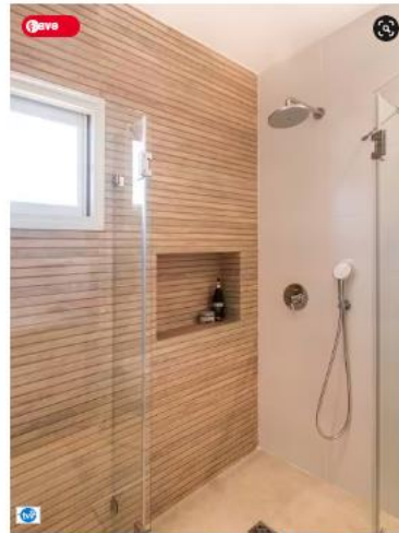
שני חדרי הרחצה שופצו