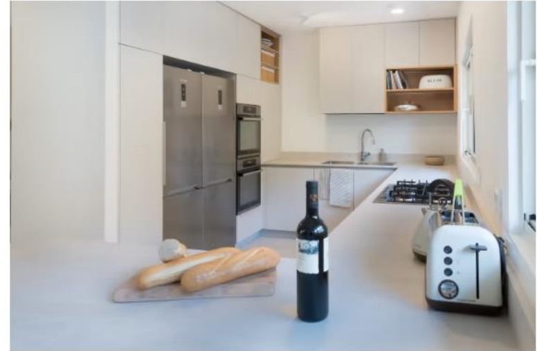
חזיתות פורמייקה בצבע מוקה ומכשירי חשמל בנימור כרום

לאתר", מספרת המעצבת. "מתחת לקרמיקת הריצפה היה רק חול, בלי יציקת בטון מתחת, אבל יותר מעניין מזה היו שורשי עץ שנדלים בתוך החול. אלו שורשי העץ שנדל בחזית הרחוב. בשקט בשקט, לאורך השנים, הם עברו את הגינה הקדמית והגיעו עד למרתף. בכל פרויקט אנחנו שואפים להרגיש את הטבע והירוק גם בתוך הבית, ליצור קשר בין החוץ לפנים, להיות מחוברים לסביבה, אבל בהחלט לא ככה התכוונו להכניס את הטבע הביתה", מתבדחת המעצבת.