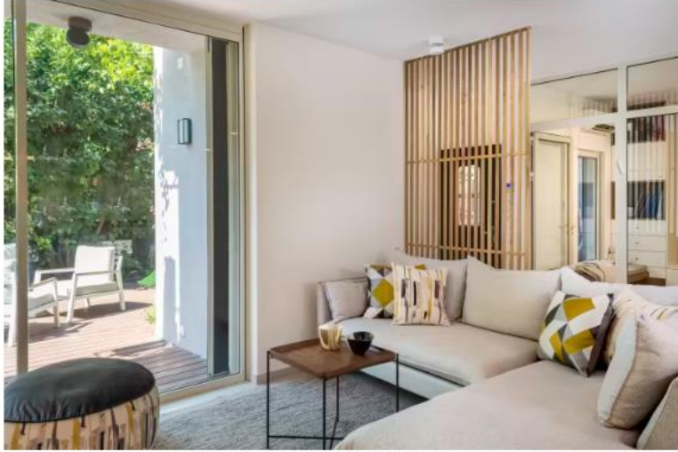
"בכל פרויקט אנחנו שואפים להרגיש את הטבע והירוק גם בתוך הבית, אבל לא ככה"