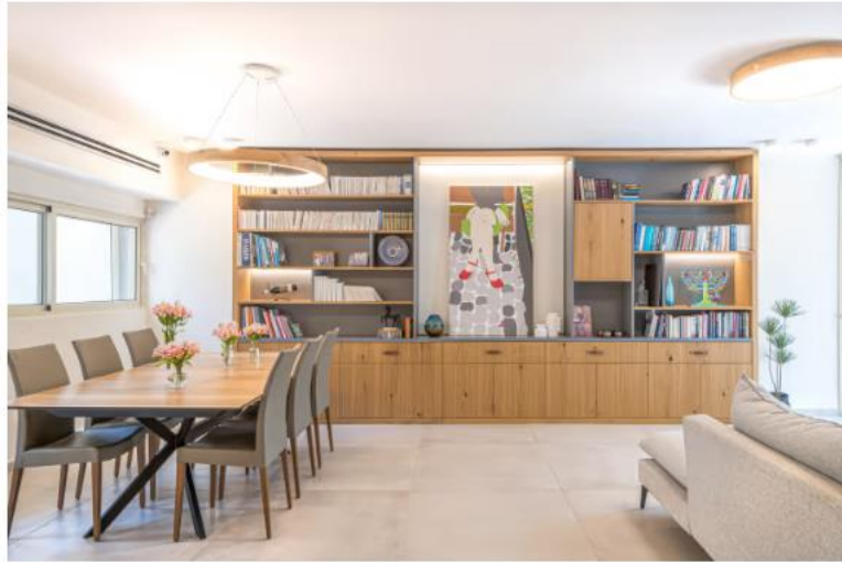
רצו להחליף מטבח וריצוף. קיבלו שיפוץ קומפלט וסטיילינג לכל החדרים