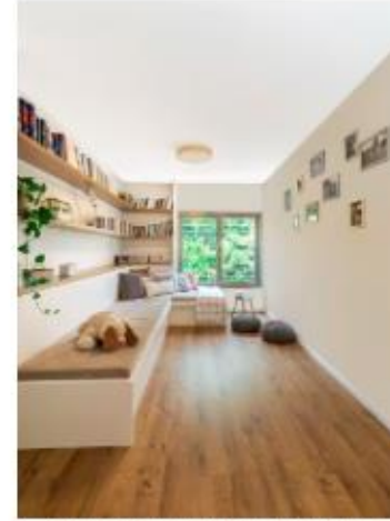
החלל הנדול בין חדרי השינה של הילדים הפך לזינת משפחה מקסימה